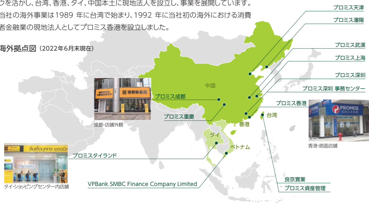
海外拠点図 (2022年6月末現在)

プロミス香港では、日本国内と同様に個人のお客さまに対し無担保・無保証による小口資金の融資を行っており、香港全土に有人店舗を26店舗展開しています。また、近年はインターネットを通じた取引ニーズが高まっており、インターネットからの申込機能を強化するため、2014年11月にWeb完結を導入するなど、お客さまのニーズをいち早く掴み、利便性の高いサービスを提供できるように努めています。